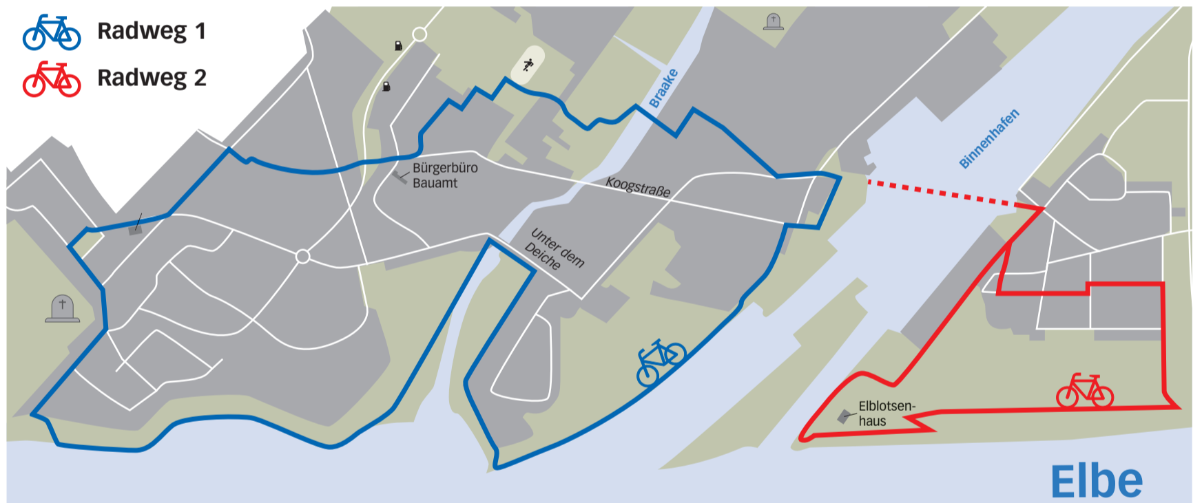
Blaue Hinweisschilder weisen den Weg auf der Nordseite, rote den Weg auf der Südseite.