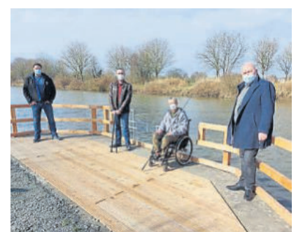
Die Politik hatte 2019 grünes Licht für den Bau der Plattform gegeben.