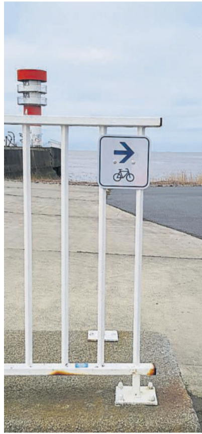
Mit rund 130 kleinen Hinweisschildern sind die beiden neuen Radrouten gekennzeichnet.

S eit nun knapp fünf Monaten ist das öffentliche Leben mal mehr oder mal weniger heruntergefahren. Weil das Infektionsgeschehen dynamisch ist, wird sich daran bis nach Ostern auch nicht viel ändern – mit Folgen für die Menschen: Die einen leiden unter Lagerkoller, andere unter Bewegungsmangel, manche unter beidem. Eine Lösung aus der Abwärts Spirale: die Heimat neu entdecken. Auch Brunsbüttel mit seiner Lage an der Nordsee, der Elbe und dem Nord-Ostsee-Kanal bietet dazu Möglichkeiten.